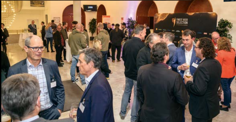
Das Abschluss-Event in Neustadt an der Weinstraße war nicht nur Siegerehrung, sondern auch kommunikatives Get-together.