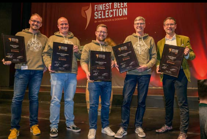
Mit fünf Bieren zieht die Brauerei Faust aus Miltenberg in die Finest Beer Selection 2023 ein.