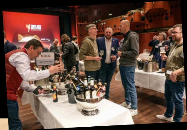
Die Verkostung aller Siegerbiere war für viele ein weiteres Highlight der Abendveranstaltung.