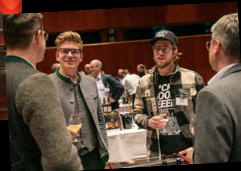
Motto des Abends: Alte Bekannte treffen, neue Kontakte knüpfen und fachsimpeln.